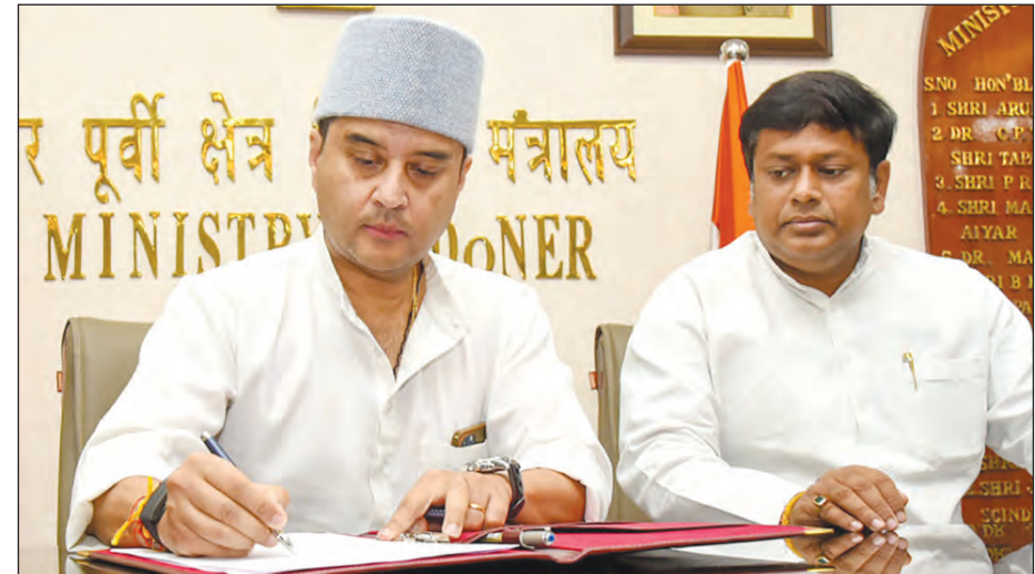
नई दिल्ली में केंद्रीय पूर्वोत्तर क्षेत्र विकास मंत्री ज्योतिरादित्य एम. सिधिया ने पदभार ग्रहण किया और पूर्वोत्तर क्षेत्र विकास राज्य मंत्री सुकांत मजूमदार ने सम्मानित करते हुए।